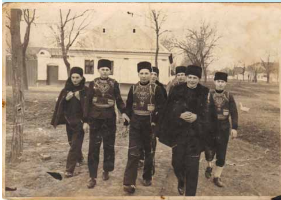
Zimný odev, mladenci, prvá polovica 20. storočia