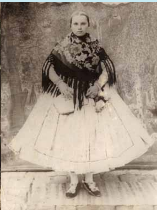
Dievocký kroj (1907)