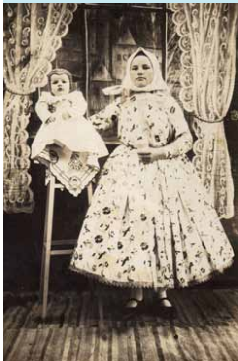
Matka s dieťaťom