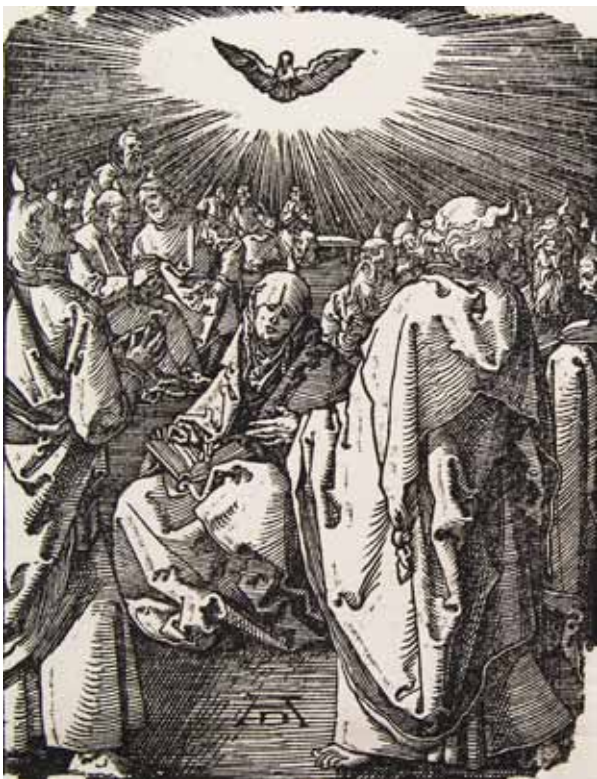
Albrecht Dürer - Zoslanie Ducha Svätého na apoštolov (1511)

Keď začneme spoznávať Boha, ktorého nám sprostredkúva Duch Boží, začneme spozná-